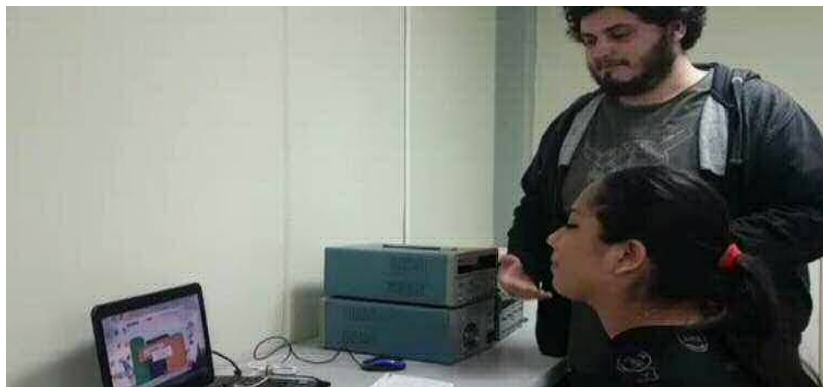
Figura 12-2. Participante del diplomado guiando una prueba de usabilidad a un juego serio.

El objetivo de este caso de estudio es obtener evidencia de que los estudiantes del diplomado adquirieron las competencias requeridas para aprender a evaluar la usabilidad en juegos serios, la Figura 11-2 muestra un estudiante guiando la prueba de usabilidad de una participante.