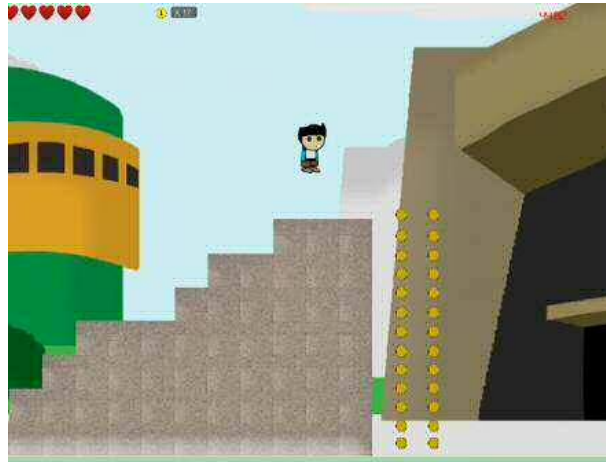
Figura 12-1. Juego serio “Grimaldo”.

El juego serio desarrollado se denominó “Grimaldo”, se trata de un videojuego de plataforma en 2D, los escenarios del juego recrean el campus de la UCOL donde se encuentra la FT (Figura 12-1). La historia consiste en que el personaje principal de juego es un estudiante de la FT que va tarde a sus clases, para lograr llegar a tiempo debe esquivar varios obstáculos que le harán complicada su llegada a clases. Para completar correctamente su misión debe lograr dos tareas: 1) Recolectar 50 monedas; y 2) Hacer el recorrido en 60 segundos o menos.