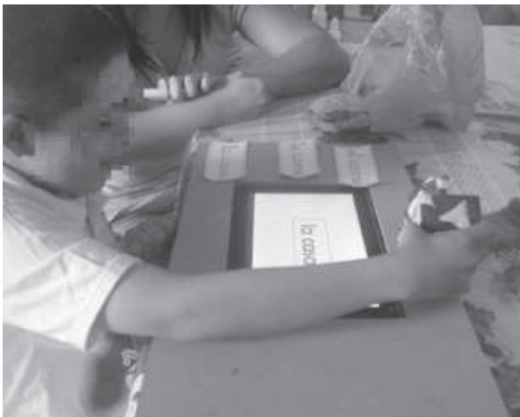
Figura 4. Evaluación preliminar.

La evaluación fue organizada como una sesión que se llevó a cabo en la casa del participante e incluyó dos fases principales (Figura 4). En la primera se informó a los padres sobre el proceso y se discutió el método educativo, después se le mostró al usuario el prototipo y sus funcionalidades y se le explicaron las tareas a realizar. Se comenzó presentándole al participante las cuatro tarjeta-palabra que se iban a utilizar en la prueba como ejercicio de calentamiento y reconocimiento del método. Para la segunda etapa se procedió a hacer los ejercicios planteados en el método, explicado en el escenario de uso.