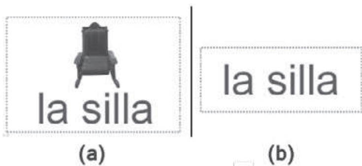
Figura 1. Tarjeta –imagen y tarjeta-palabra.